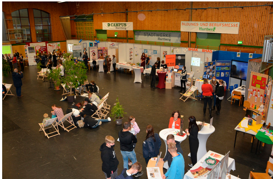
Die Hartberger Bildungs- und Berufsmesse findet am Freitag, 17. November und Samstag, 18. November in der Stadtwerke-Hartberg-Halle heuer zum 10. Mal statt.